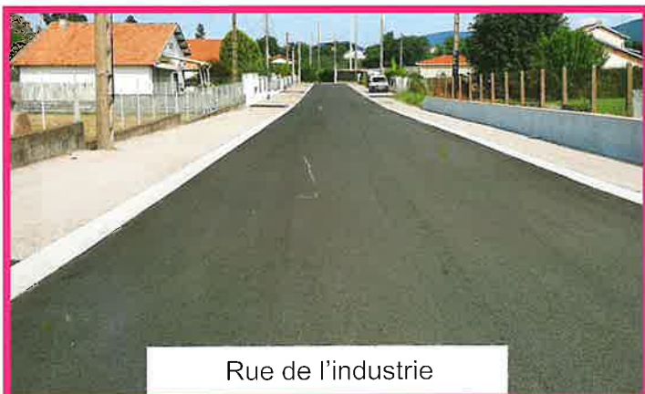
Rue de l'industrie