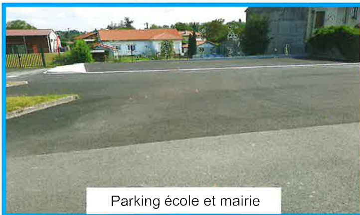
Parking école et mairie