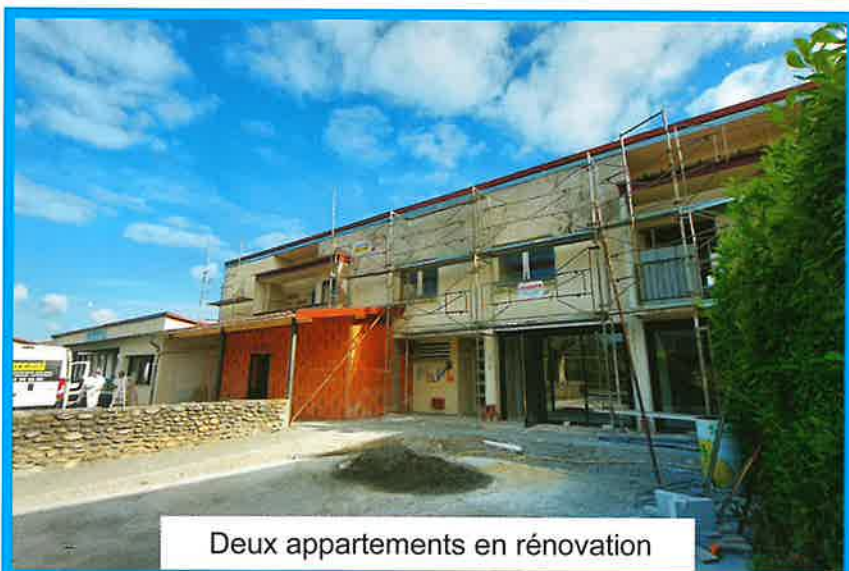
Deux appartements en rénovation