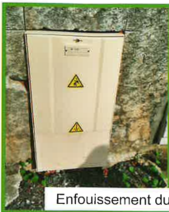
Enfouissement du réseau électrique